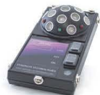
多向超音波發射器