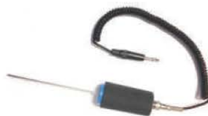
接觸式超音波感測棒