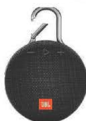
藍芽音響 Ref. LKSSPEAKER