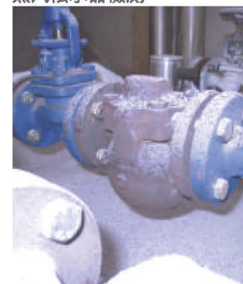
電弧局部放電檢測