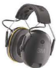
藍芽耳機 Ref. LKSHEAD